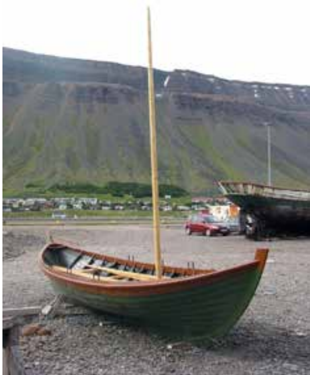
Árabáturinn Þór á sýningu á Ísafirði 2017.