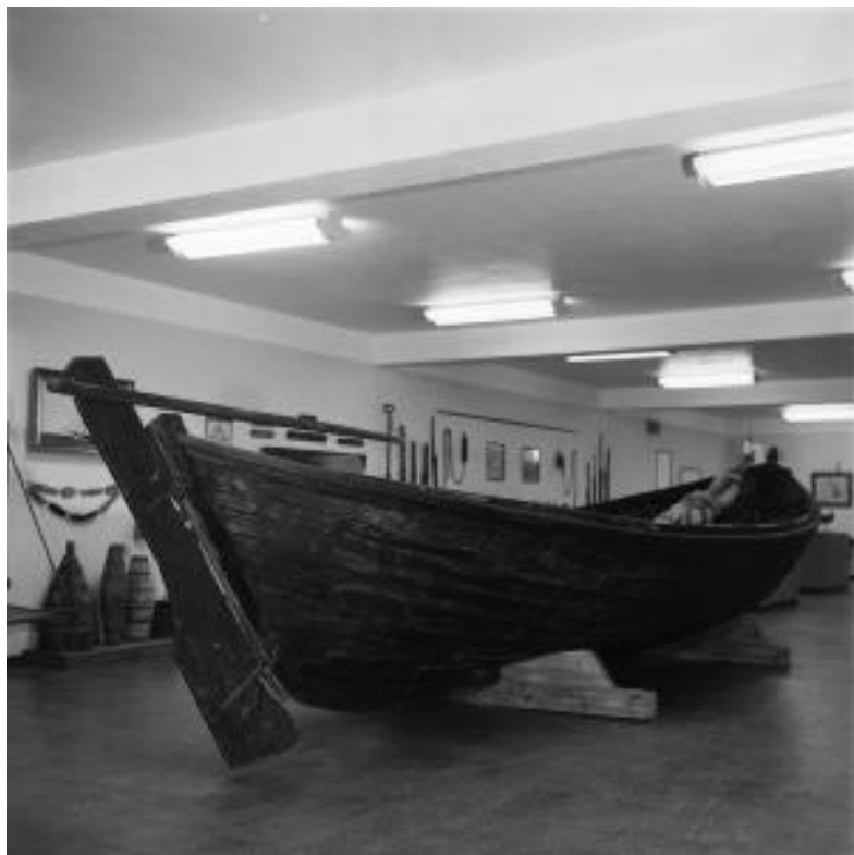
Engeyjarskipið var lengi til sýnis í s.k. sjóminjasafni á neðstu hæð Þjóðminjasafnsins við Suðurgötu. Myndin er tekin 1966. Ljós. Þjóðminjasafn Íslands. ÞM-5431.

Óbreyttur og upprunalegur árabátur með Engeyjarlagi, fiskibátur, frá því í byrjun 20. aldar með öllum búnaði. Hann er skráður safngripur og friðaður á grundvelli aldurs. Síðasti báturinn sem smíðaður var í Engey.