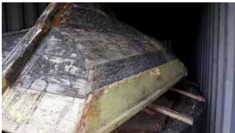
Selabytta frá Dalvík árið 2018.