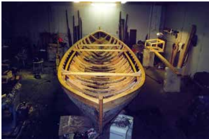
Friðþjófur í viðgerð í Bolungarvík 2002.