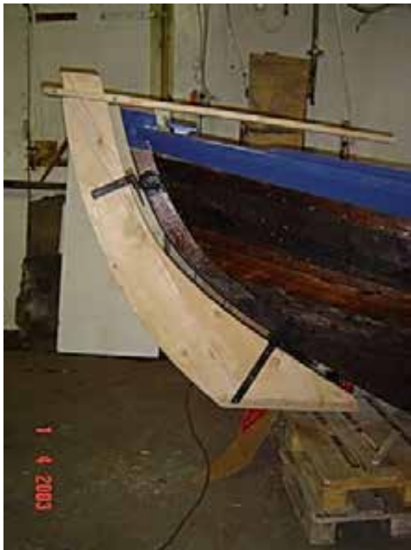
Friðþjófur, komið nýtt stýri og búið að tjarga skrokkinn. Ljós. Ágúst Ólafur Georgsson.

Friðþjófur er með breiðfirsku lagi, upphaflega fiskibátur, en var breytt í uppskipunarbát 1928 á vegum Sláturfélags Reyknesinga og er einn af fáum slíkum sem varðveist hafa. Gert var við bátinn eftir að hann komst í eigu Þjóðminjasafnsins þar sem upprunaleiki og gömul handbrögð voru höfð í öndvegi. Viðgerðin tók mið af útliti bátsins þegar hann var uppskipunarbátur. Friðþjófur er bæði aldursfriðaður og skráður safngripur.