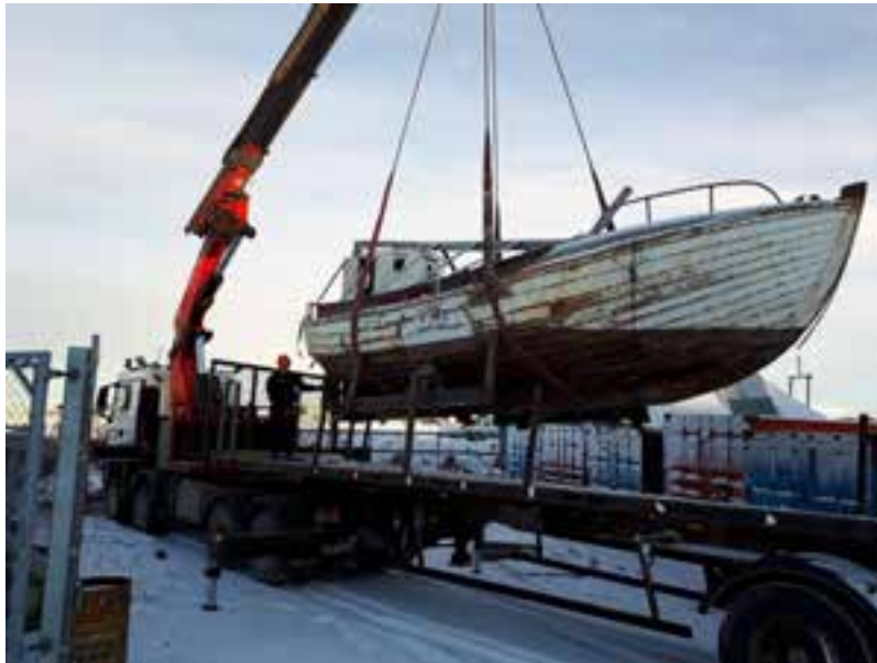
Snari á leiðinni í fóstur og gagngerða viðgerð 19. janúar 2018.

Súðbyrtur fiskibátur, hálfþiljaður, sem smíðaður var í Hvallátrum á Breiðafirði um miðja tuttugustu öld. Báturinn hefur verið afhentur einkaaðila til varðveislu samkvæmt sérstökum samningi enda verði hann færður í sitt gamla horf og gerður sjóhæfur.