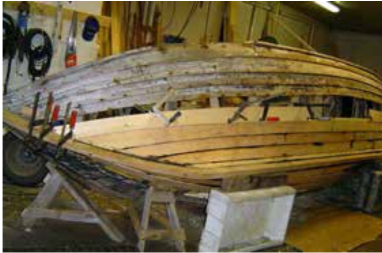
Frá viðgerð þórs 2005.