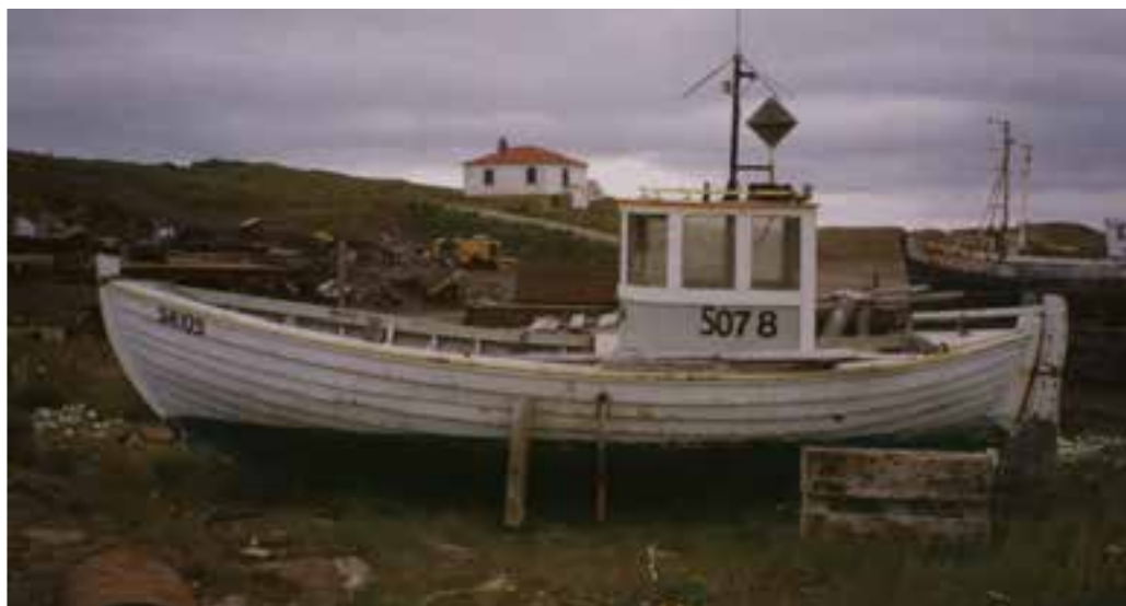
Alda SH 105 við skipasmíðastöðina í Stykkishólmi.