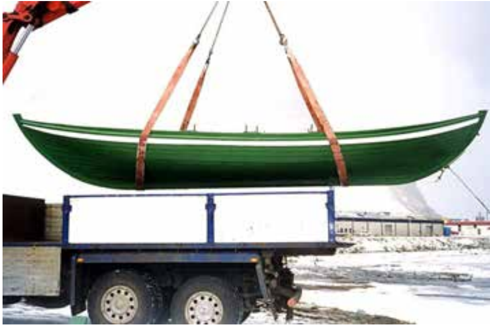
Ógri er einstaklega formfagur eins og sjá má á þessari mynd.