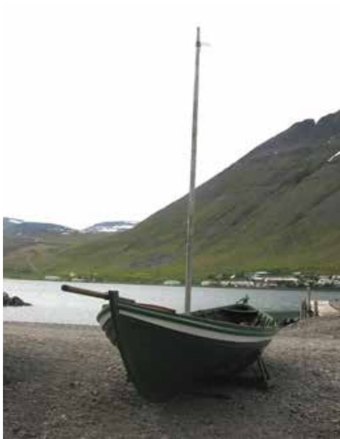
Ögri á sýningu á Ísafirði.