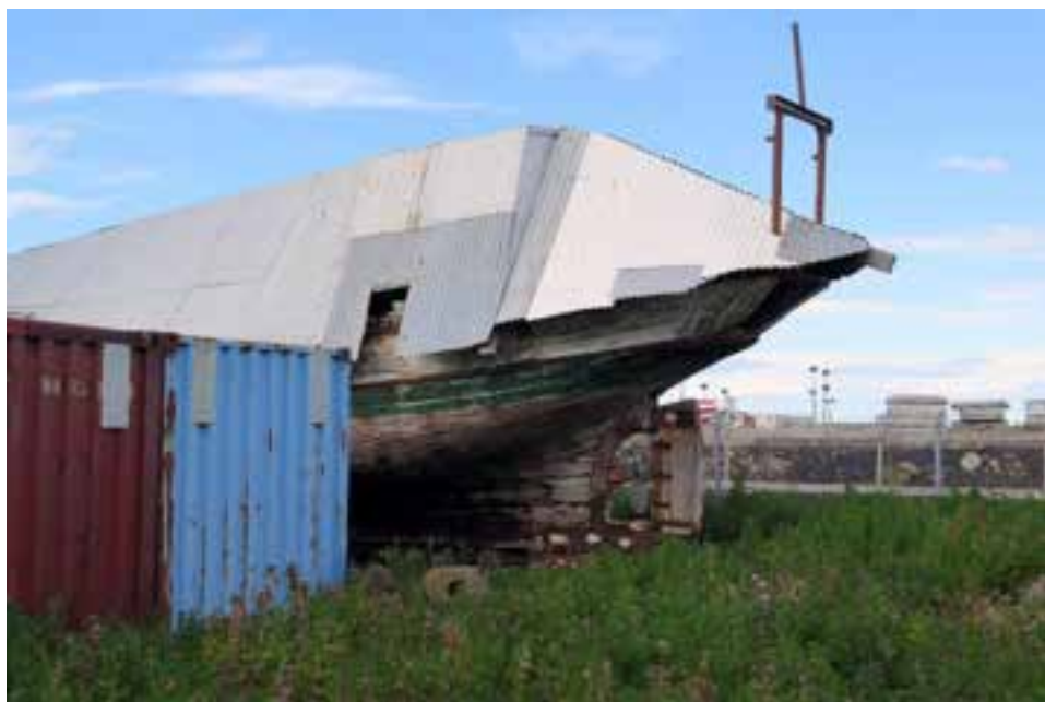
Höfrungur á geymslustað í Kópavogi 2017.

Einn fárra báta sem enn eru til með þessu gamla formi, þ.e. kútterslagi. Elsti varðveitti, plankabyggði bátur sem smíðaður er á Íslandi. Hann er aldursfriðaður og skráður safngripur.