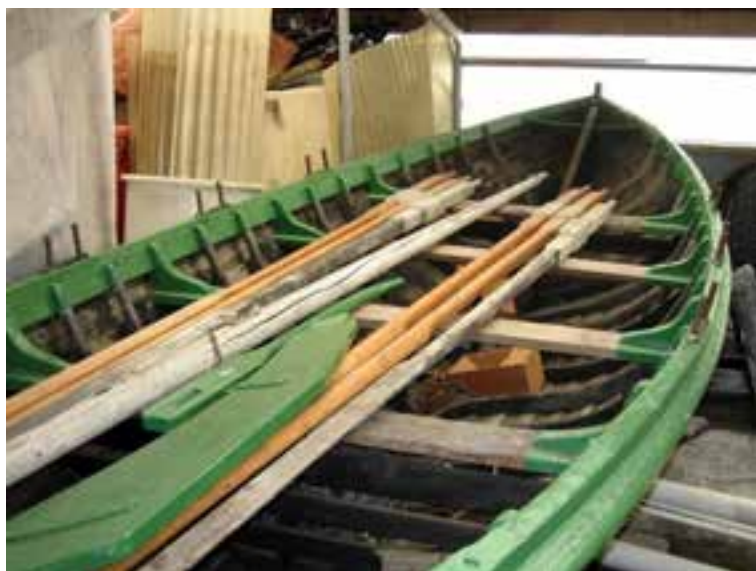
Ögri í geymslu á Ísafirði. Hér sjást upphafleg ræði, mastur og tvær árar.

Ögri er eini vestfirski sexæringurinn sem varðveist hefur óbreyttur og er glæsilegur fulltrúi hinna gömlu áraskipa við Ísafjarðardjúp. Hann var í fyrstu notaður sem fiskibátur en seinna sem flutningabátur. Ögri var tekinn til gagngerðrar viðgerðar eftir að Þjóðminjasafn Íslands eignaðist hann og var þá haldið eftir eins miklu af upprunalegum viðum og unnt var. Lag bátsins er hið upprunalega og nýir viðir sniðnir þeim eldri. Hann er skráður safngripur og friðaður á grundvelli aldurs.