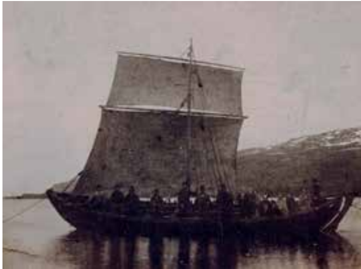
Hákarlaskipið Ófeigur 1898 undir fullum seglum með 18 manns um borð. Lpr. 2963.