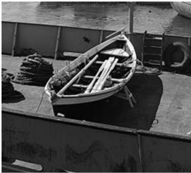
Landhelgisbáturinn Ingjaldur kemur til Reykjavíkur með vitaskipinu Árvakri árið 1973. PM-6429.