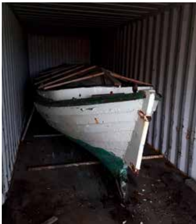
Mávur SH 213. Myndin er tekin árið 2018.