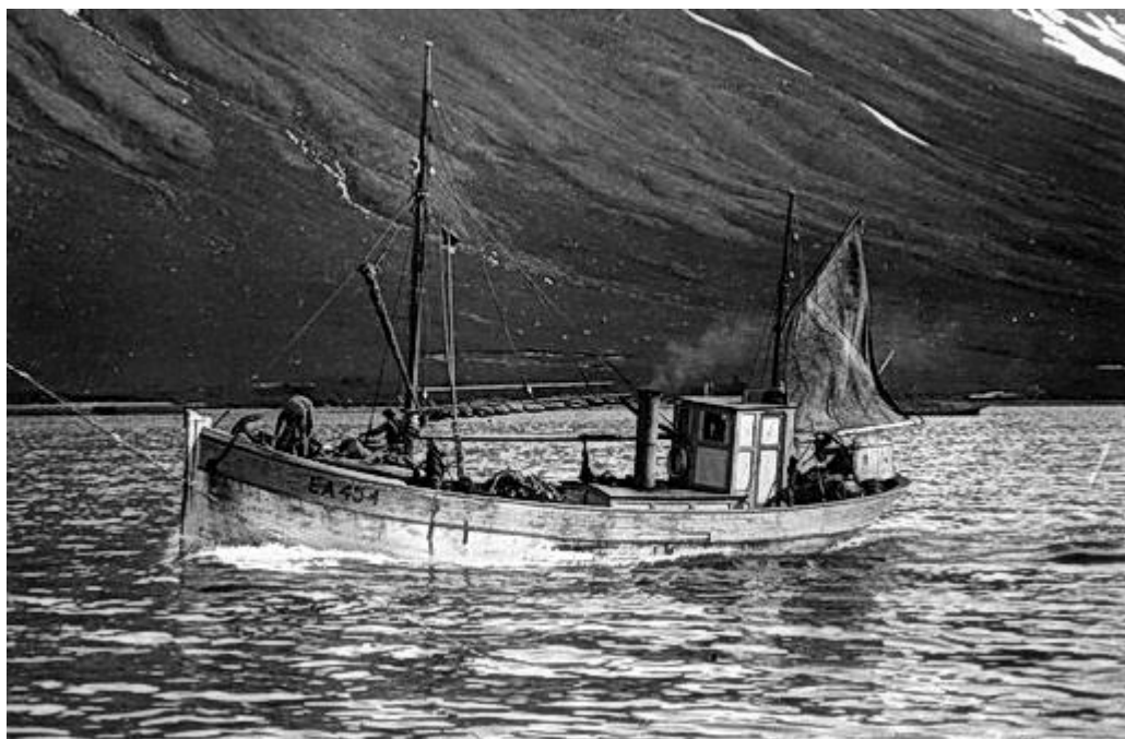
Kári Sölmundarson EA 454 (seinna Höfrungur BA 60) á siglingu.