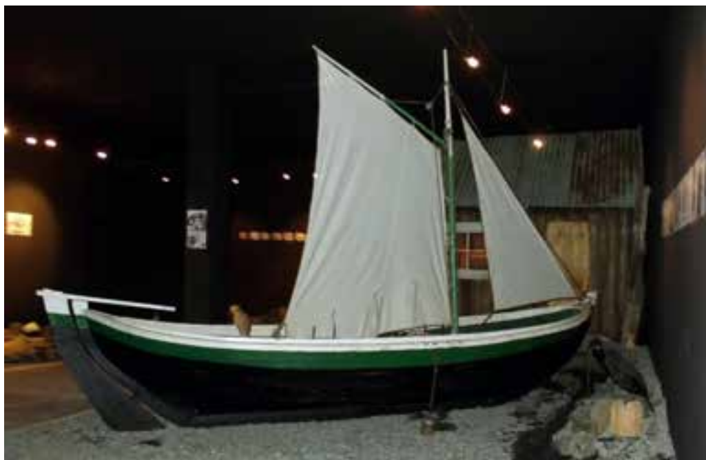
Hallsteinsnessbátur á sýningu á Reykhólum. Ljósmynd af báta og hlunnindasýningunni á Reykhólum.