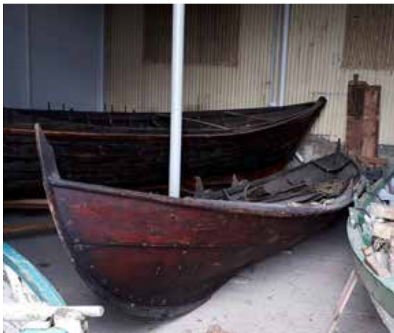
Norskur kirkjubátur. Ljósmynd. Ágúst Ólafur Georgsson 2018.