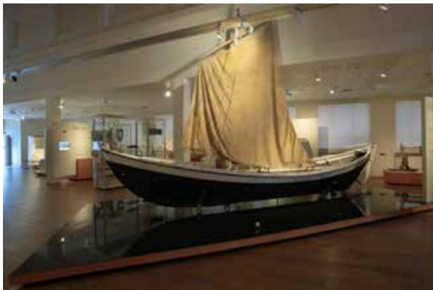
Landhelgisbáturinn Ingjaldur á grunnsýningu Þjóðminjasafns Íslands 2018.