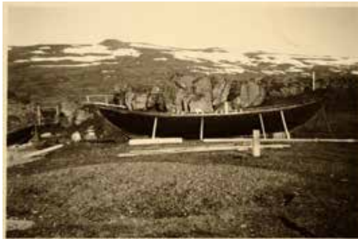
Ófeigur 1915 í Ófeigsfirði á Ströndum. Lpr-1326.