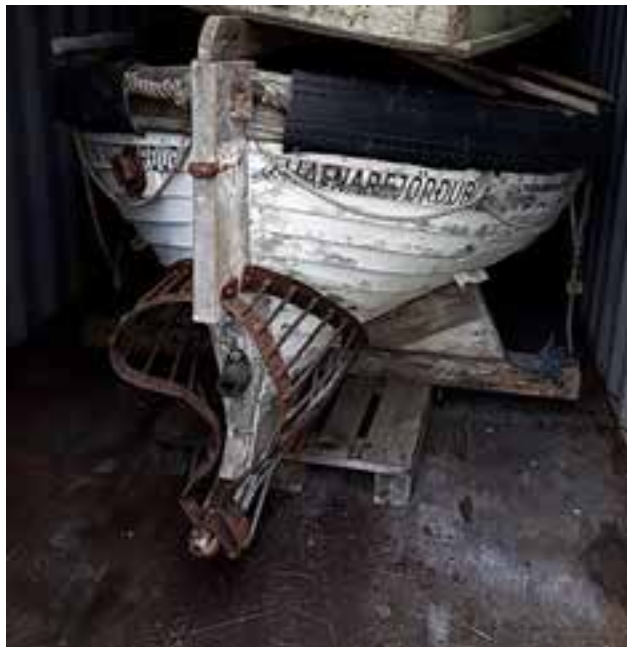
Björgunarbátur af Fáki GK 24. Myndin er tekin árið 2018.