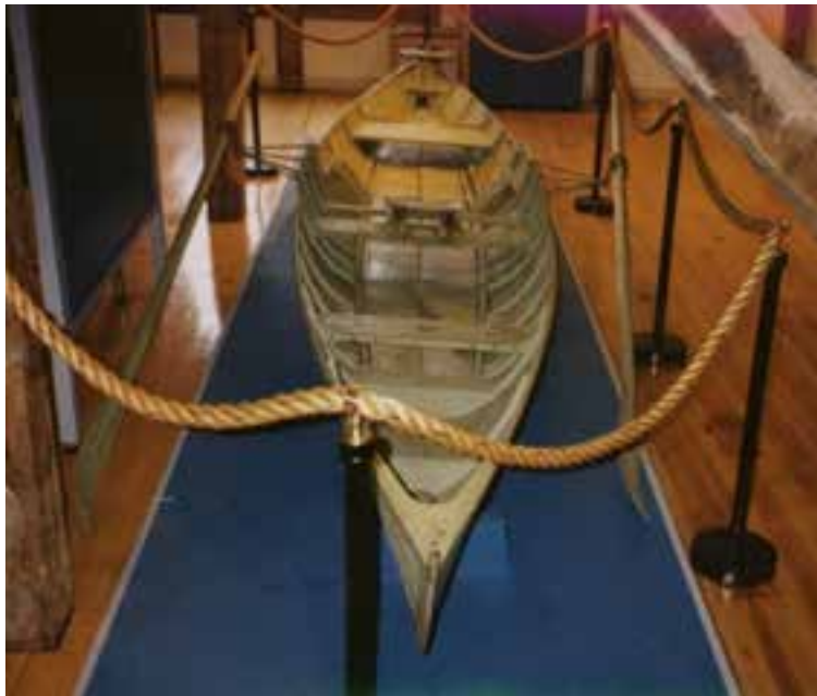
Fánabáturinn á sýningu í sjóminjasafninu í Hafnarfirði 1993.

Hefðbundinn enskur kappróðrabátur, venjulega kallaður „fánabáturinn“ þar sem hann kemur við sögu í fánamálinu svo kallaða 12. júní 1913, en það markaði spor í baráttu fyrir íslenskum þjóðfána. Báturinn er mjög upprunalegur og í góðu standi. Hann hefur einstakt sögulegt gildi og er bæði aldursfriðaður og skráður safngripur.