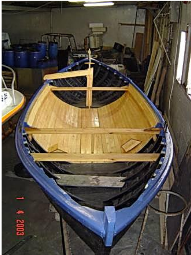
Friðþjófur að lokinni viðgerð 2003.