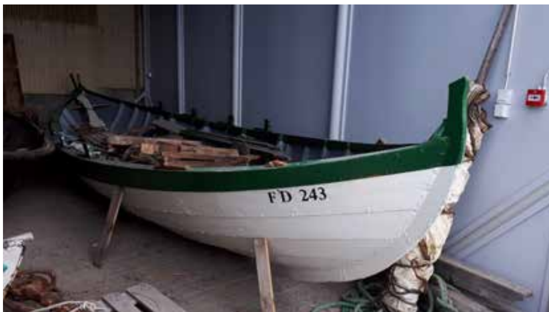
Hvalurinn FD 243 í geymslu í Kópavogi árið 2018.

Upprunalegur og vel með farinn færeyskur grindhvalveiði- og fiskibátur sem á sér skráða sögu í Færeyjum en enga á Íslandi. Hann er aldursfriðaður og skráður safngripur.