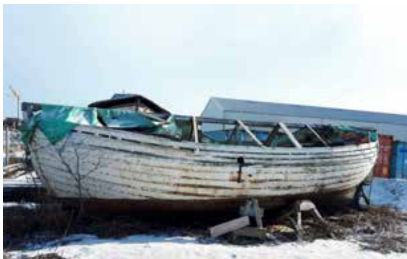
Norðurljós ÍS 537 árið 2018.