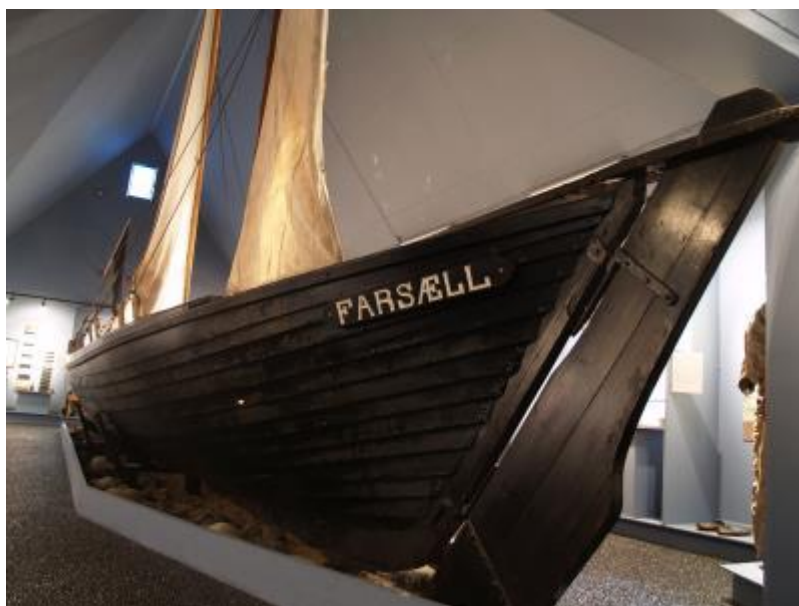
Farsæll á sýningu á Eyrarbakka.

Síðasti arabáturinn sem gerður var út frá Þorlákshöfn og jafnframt sá eini sem eftir er með s.k. Steinslagi. Báturinn er í góðu standi og hefur verið í vörslu Sjóminjasafnsins á Eyrarbakka í áratugi. Hann er skráður safngripur og aldursfriðaður.