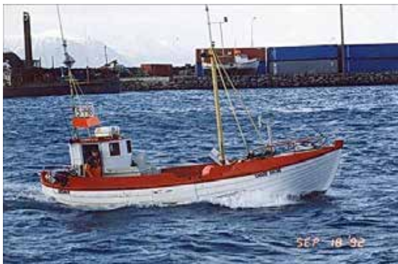
Snari á siglingu 1992.