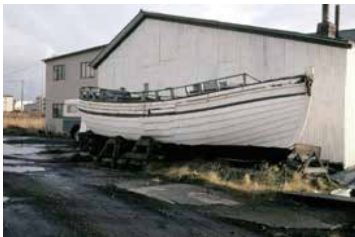
Norðurljós á Laugarnestanga í Reykjavík 1979. Ljósmynd. Þjóðminjasafn Íslands. Skg-4233.

Súðbyrtur vélbátur með þilfari sem smíðaður var í Bolungarvík 1939 og gerður út þaðan til fiskveiða í fjölda ára. Báturinn er skráður safngripur og nýtur friðunar á grundvelli aldurs en er mikið farinn að láta á sjá.