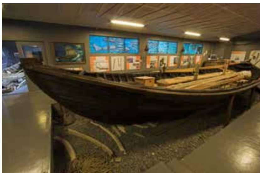
Ófeigur á sýningu á Reykjum í Hrótafirði.