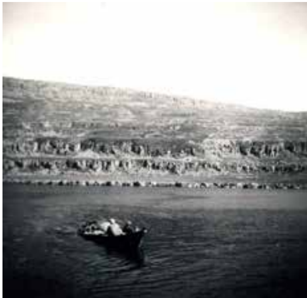
Árabáturinn Þór í flutningi á Mjóafirði um 1950-1960.