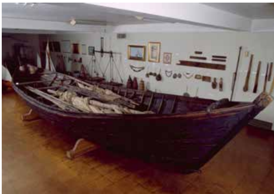
Engeyjarskip á sýningu í Þjóðminjasafni Íslands.