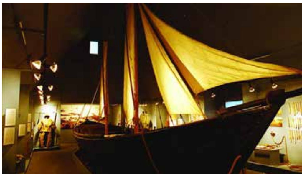
Farsæll á sýningu í Sjóminjasafninu á Eyrarbakka.