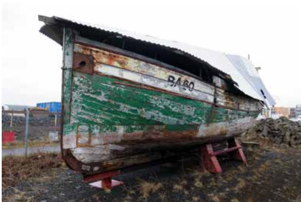
Höfrungur 2018. Bárujárnsþak var byggt yfir bátinn fyrir allmörgum árum.