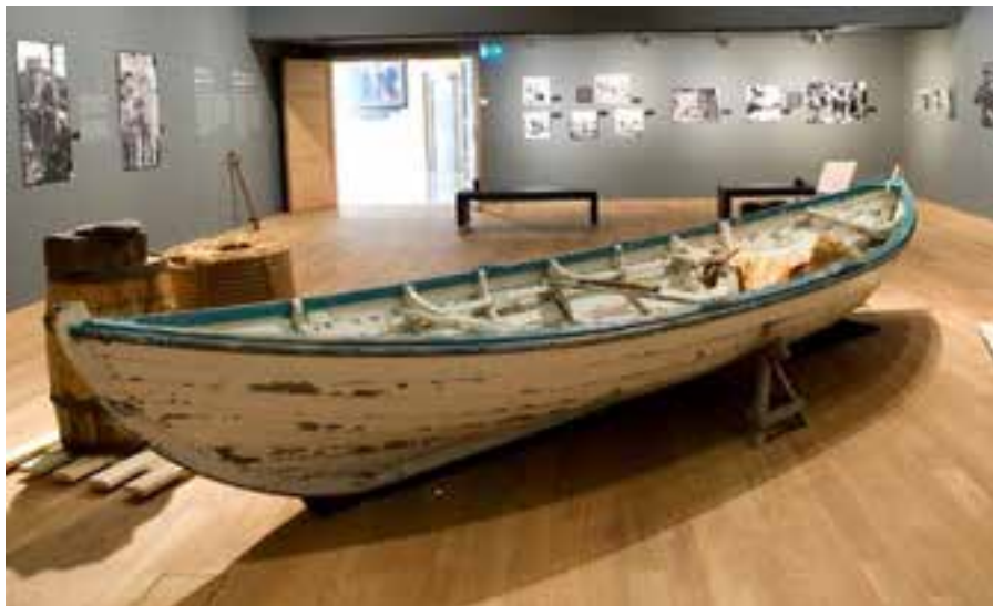
Léttbátur af togaranum Garðari GK 25. Ljósmynd. Þjóðminjasafn Íslands.