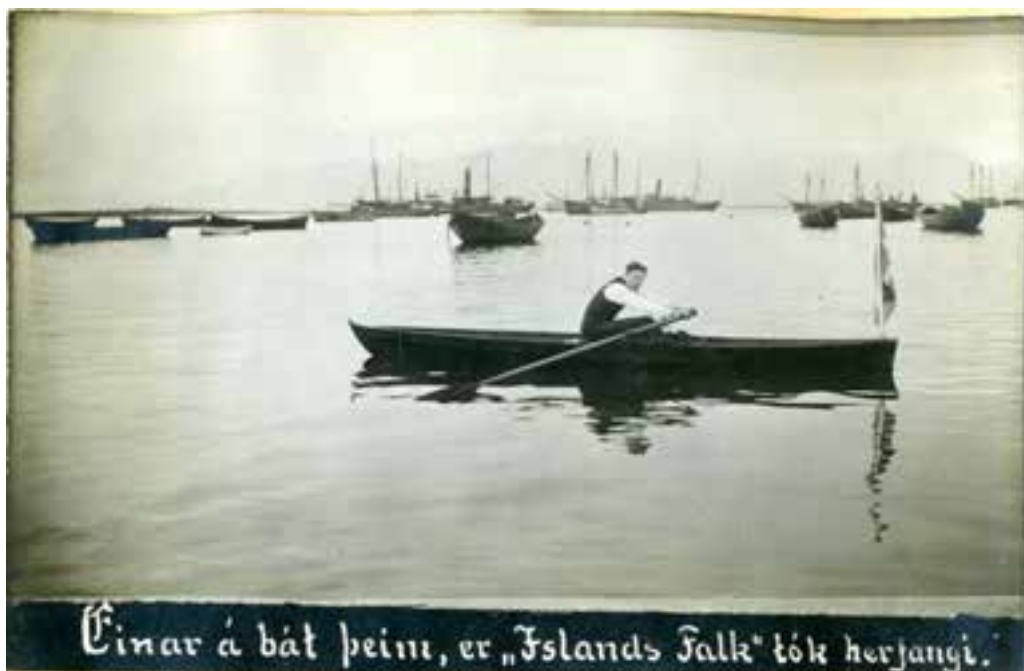
„Fánabáturinn“ á Reykjavíkurhöfn 1913.